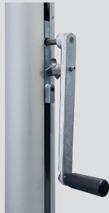
Kurbelhissvorrichtung FlagLift , Handkurbel