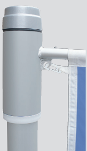
Mastkappe mit Rotor, Teleskopausleger