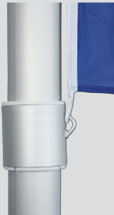
Zubehör: Fahnenstraffer, unverlierbar