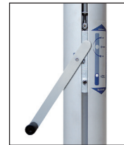
Kompaktantrieb, Handkurbel mit Entsperrstift