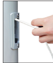
Hissen der Fahne durch horizontales Ziehen, Einholen durch Loslassen.

klassische Innenseilführung mit dem im Mastrohr laufenden PES-Hisseil. Die Handhabung des Hisseiles erfolgt über das Bediengehäuse mit ( SchnellFixierSystem ) -SFS mit sperrbarem Türchen. Hissen und Abnehmen der Fahnen erfolgt durch Ziehen bzw. Nachlassen des Hisseiles. Bei Loslassen arretiert das Hisseil selbsttätig in der Spezial-Seilklemme im SFS-Gehäuse.