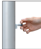
Entsperrstift ziehen, Riegel nach unten schieben: ENTSICHERN

FlagLift besteht aus dem Kompaktantrieb mit VA-Antriebsrad, dem VA-Hisseil und dem Langschlitten mit Federvorspannung. Alle Bauteile befinden sich in der Mastnut. Die Seil-arretierung wird durch eine Federbremse bewirkt, die durch einfaches Anheben des Sicherungsriegels das Antriebsrad blockiert und den Steckerzugang für die Handkurbel verschließt. Die Entriegelung erfolgt mittels eines Spezial-Entsperrstiftes in einem Handgriff.