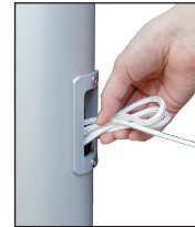
Nach dem Hissen Seil in Schlaufen legen und als Bund in das Bediengehäuse stecken.