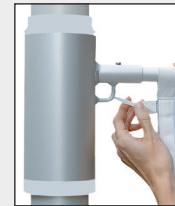
Fahne auf Auslegerrohr aufziehen und obersten Karabiner in Rotoröse einhaken.