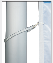
Die mittleren Karabiner in die FahnenSchlingen einhaken.